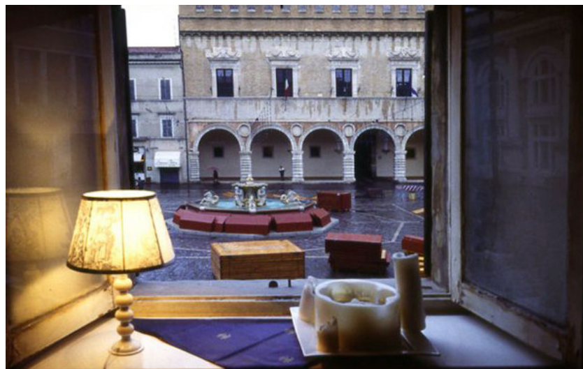
Umberto Dolcini, Piazza del Popolo - Pesaro